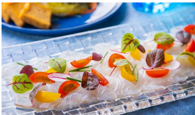
豊洲市場直送の魚介類 自家製マリネ カラマンシーベネグレット