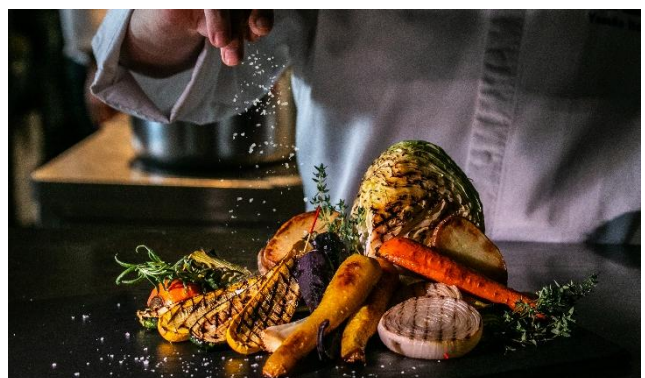
関東近郊野菜ロースト