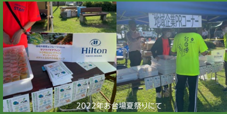
2022年お台場夏祭りにて