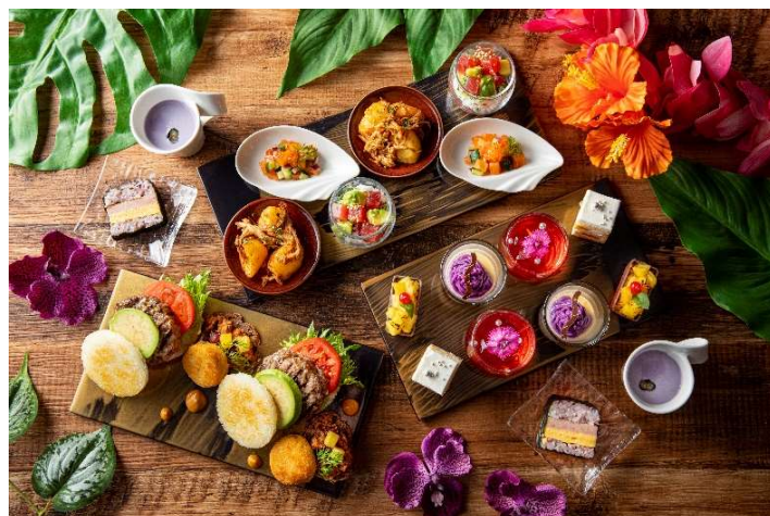
平日限定開催のハイティー