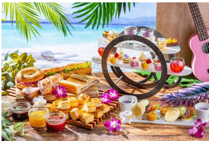
スペシャルアフタヌーンティー「#ヌン活」