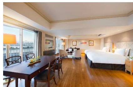
ファミリールーム ご家族やグループでのご利用に 最適な 80 平米